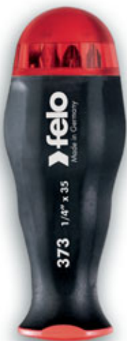
with bitholder for power tool