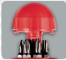
telescopic depot for 7 bits Teleskopmagazin für 7 Bits